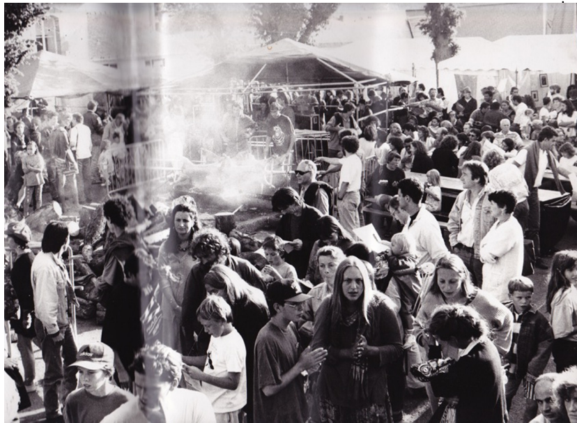
Clôture du festival Berbères 1994: un méchoui au milieu de la Place (plus possible aujourd'hui!)