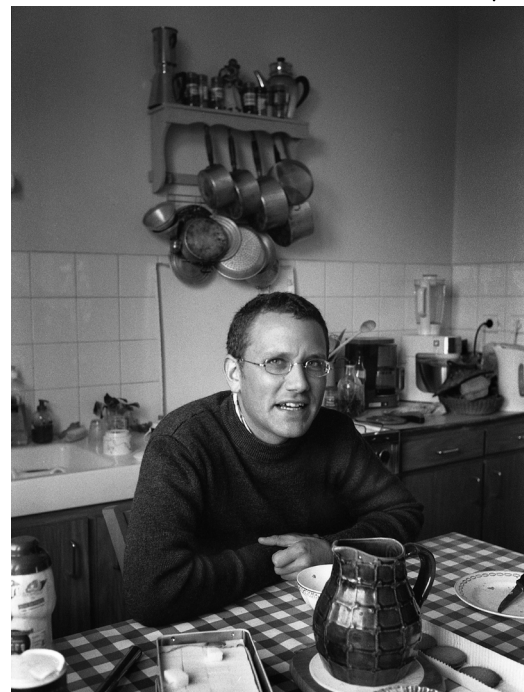
« An Aotrou Caous »

Neb a larfe ez eo skoueriet boutin oberenoù Bastian. Evel ma tegasfent ur skeudenn kozh deus ar vro ha deus ur sevenadur war e zalaroù. N'on ket a-du. Me 'm eus santet hiraezh kentoc'h. Evel m' 'en defe c'hoant Bastian dastum roudoù diwezhañ ur prantad istor oc'h echuiñ. Desket en deus brezhoneg gant tud kozh ur rummad a zo o vont kuit tamm-ha-tamm. Ar santimant 'm eus e glask derc'hel ur roud deus outo war an douar. Un homaj d'ar vro 'vel m'edo a-