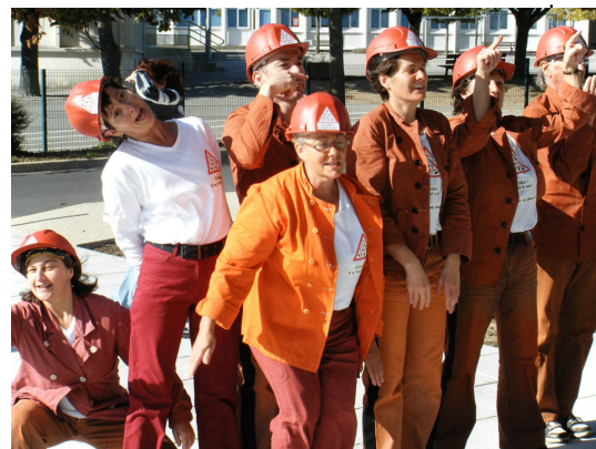
« C'est là, c'est pas ailleurs », jeudi 29 août, à 21h, à l'Auditorium