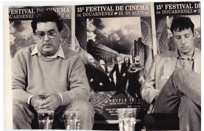
John Hume (à gauche), futur prix Nobel de la Paix en 1998 et Ian Paisley Junior débattant en 1992